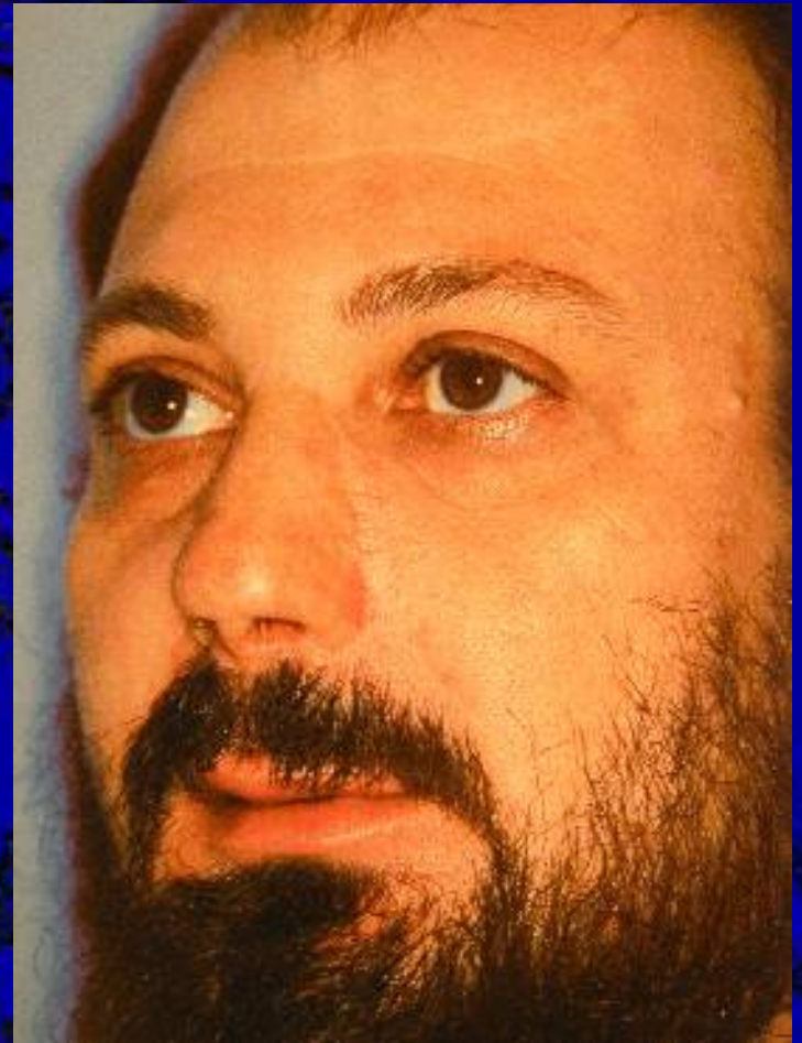
PAZIENTE DOPO DELL'INTERVENTO